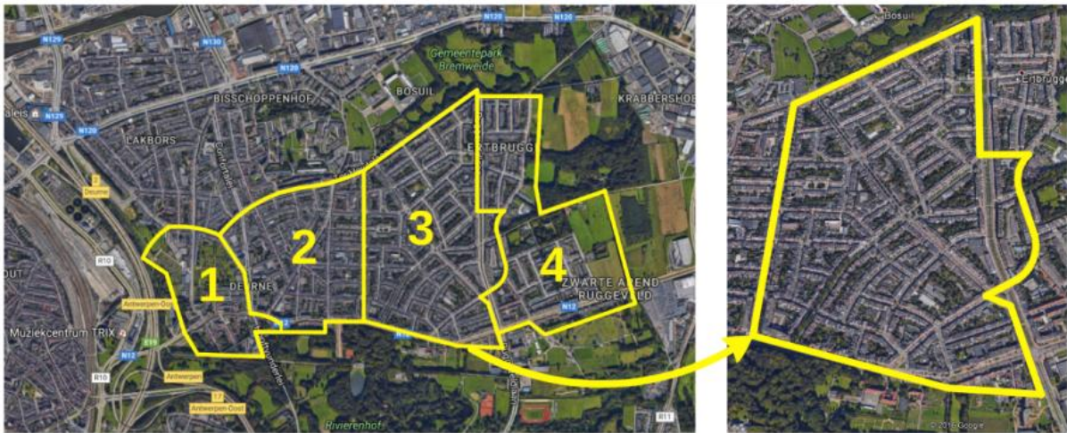
Gebied 4 = Deurne Zwarte Arend & Ertbrugge